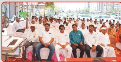
संस्थेच्या ६ व्या चन्होली बु. शाखेच्या उद्घाटनप्रसंगी संस्थेचे सभासद खातेदार हितचितक महिला बंधु-भगिनी