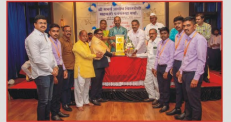
सन २०२२-२३ च्या उत्कृष्ट शाखा कामकाज केल्याबद्दल सत्कार करताना संस्थेचे संचालक सल्लागार मंडळ व सोळु शाखा कर्मचारी