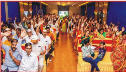
संस्थेच्या २२ व्या वार्षिक सर्वसाधारण सभेस उपस्थित सभासद बंधु-भगिनी व हितचिंतक