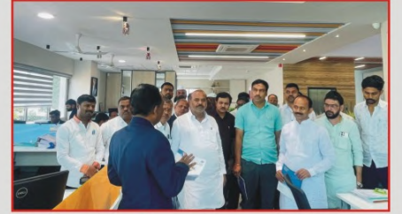
संस्थेच्या वतीने सांगली येथे कर्मवीर भाऊराव पाटील पतसंस्था व मल्टिस्ट्रेट येथे पतसंस्था अभ्यास दौरा आयोजित करण्यात आला होता. यावेळी उपस्थित संस्थेचे अध्यक्ष आधारस्तंभ संचालक सल्लागार मंडळ व कर्मचारी वर्ग