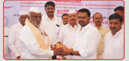
संस्थेच्या ६ व्या चन्होली बु. शाखेची उद्घाटनप्रसंगी मान्यवरांचा सत्कार करताना संस्थेचे अध्यक्ष, आधारस्तंभ, संचालक व सहागार मंडळ