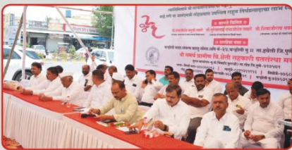
संस्थेच्या ६ व्या चन्होली बु. शाखेची उद्घाटनप्रसंगी उपस्थित संचालक सहागार मंडळ