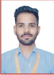
कु.प्रतिक ज्ञा.पानसरे अकॉंटंट/पासिंग ऑफिसर खालुंब्रे