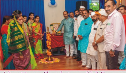
संस्थेच्या २२ व्या वार्षिक सर्वसाधारण सभेवेळी दिपप्रज्वलन करताना संस्थेचे अध्यक्ष, संचालक व सल्लागार मंडळ