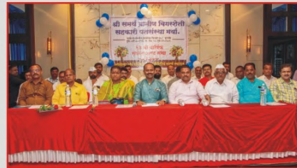
संस्थेच्या २२ व्या वार्षिक सर्वसाधारण सभेस उपस्थित संस्थेचे अध्यक्ष,आधारस्तंभ,उपाध्यक्ष संचालक सल्लागार मंडळ व सभासद मान्यवर